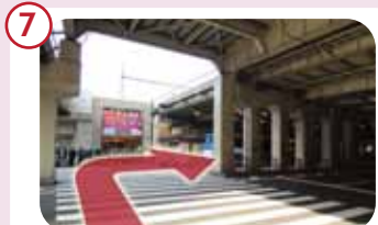
桜橋口を右手に進むと横断歩道があります。そこを渡り、右手(高架下)へ進みます。