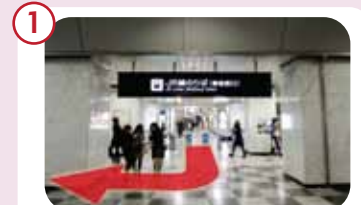
御堂筋口から行く場合、改札を出て右手へお進みください。