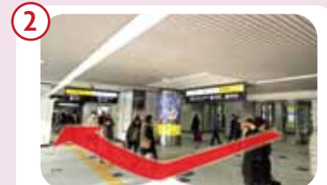
御堂筋口を右手に進むと市営バス乗り場があります。その手前を右手にお進みください。