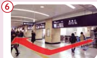
桜橋口から行く場合、改札を出て右手(梅三小路側)へお進みください。