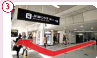
南口から行く場合、改札を出て右手(大丸側)へお進みください。