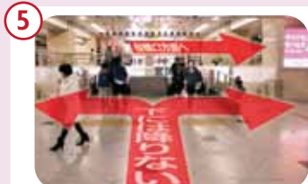
直進すると階段がありますが、階段は降りずに右手、桜橋口方面へお進みください。