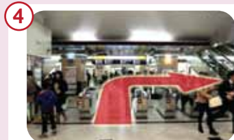
中央口から行く場合、改札を出て右手(大丸側)へお進みください。