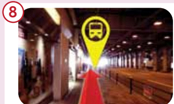
高架下を約100mほど進むとシャトルバス乗り場がございます。